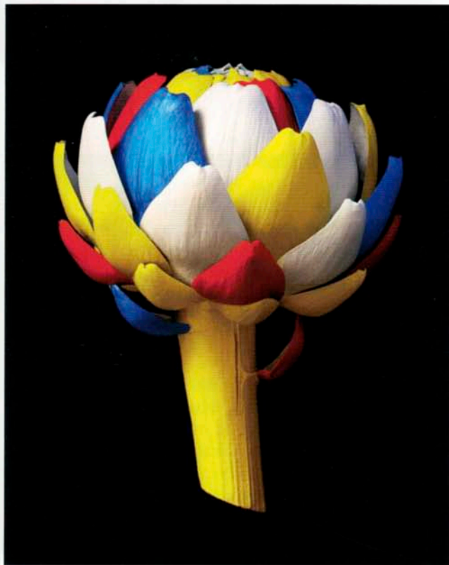
Arti Show Les Grandes Personnes, 2013