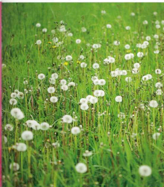
Imagine, c'est tout blanc! Les Grandes Personnes, 2015