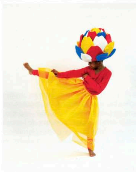
Arti Show Les Grandes Personnes, 2013

L e jeu qui est au cœur de l'activité de l'enfant est également au centre de l'activité de nombreux artistes contemporains. Les uns et les autres bousculent les règles, agitent les imaginaires, décloisonnent les espaces et les genres. Pour Claire Dé, au nom emblématique, chaque projet est un champ d'expérimentation global. Les livres et les installations en dialogue construisent un univers plastique inattendu, et placent le lecteur en position d'explorateur.