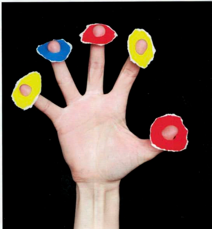
Dèvine : à quoi on joue ? Les Grandes Personnes, 2015